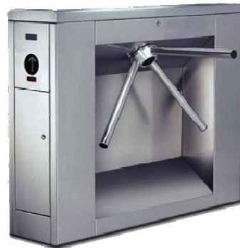
ML-KT330E / ML-KT330Ei

機箱(L×W×H)：460×285×950 mm 欄杆長：460mm 上杆中心高：820mm